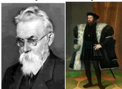
В. И. Вернадский Фердинанд Габсбург, Император Священной Римской империи

Задание 1. Какую роль в развитии музейного дела сыграли представленные на иллюстрациях исторические личности?